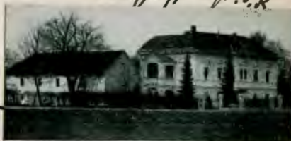
„Graffegg“, Schwanenstadt 26. X. 28